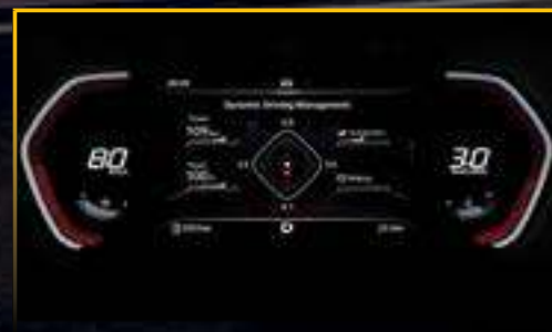
MÀN HÌNH ĐA THÔNG TIN HIỂN THỊ THÔNG SỐ VẬN HÀNH