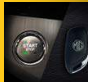
NÚT KHỞI ĐỘNG START/ STOP & CHÌA KHÓA THÔNG MINH