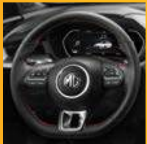
VÔ LĂNG 3 CHẾ ĐỘ LÁI