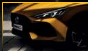
ĐÈN PHA LED TỰ ĐỘNG