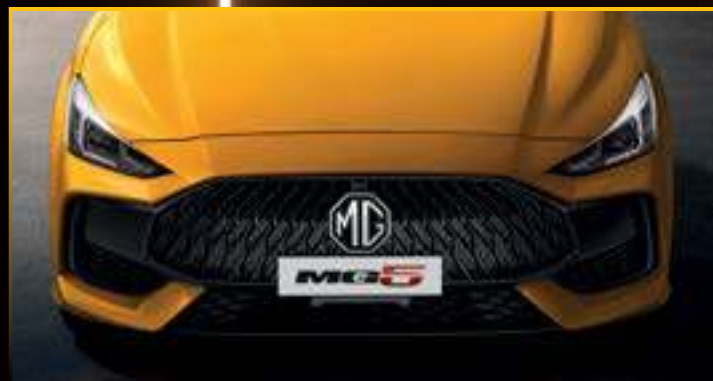
LƯỚI TẢN NHIỆT KỸ THUẬT SỐ THIẾT KẾ HÌNH NGỌN LỬA