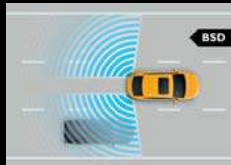
HỆ THỐNG CẢNH BÁO ĐIỂM MÙ (BSD) *

AN TOÀN VƯỢT MONG ĐỢI với hệ thống bảo vệ đồng bộ của MG, hệ thống an toàn với công nghệ từ châu Âu được tích hợp các tính năng như Cảnh báo điểm mù, Hệ thống hỗ trợ chuyển làn, Cảnh báo phương tiện cắt ngang phía sau, Cảnh báo phương tiện va chạm từ phía sau, Hệ thống làm khô phanh đĩa, Hệ thống treo trước MacPherson và treo sau thanh giằng xoắn giúp tăng độ cứng, mang lại sự an toàn chắc chắn. Bên cạnh đó, MG5 được trang bị Hệ thống 6 túi khí an toàn và Camera 360 hiển thị 3D giúp bạn an tâm di chuyển trên mọi cung đường.