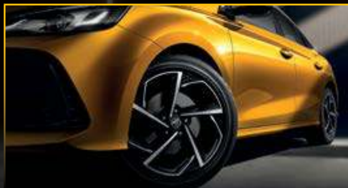
MÂM XE HỢP KIM 17" VỚI 2 TÔNG MÀU THIẾT KẾ MÔ PHỎNG LƯỚI RIU TOMAHAWK*