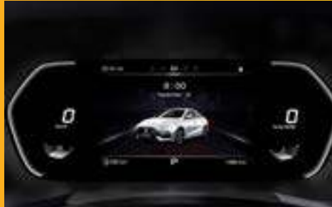
MÀN HÌNH ẢO 7" VIRTUAL COCKPIT *