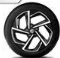
17" Bản 1.5L LUX