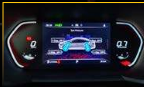
CẢM BIẾN ÁP SUẤT LỐP TRỰC TIẾP (TPMS)