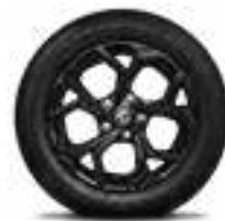
16" Bản 1.5L STD