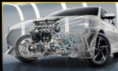
ĐỘNG CƠ 1.5L CVT 112HP, MÔ-MEN XOẮN CỰC ĐẠI 150NM

Khám phá trải nghiệm lái mới với động cơ 1.5L và hộp số vô cấp CVT sản sinh công suất cực đại 112Hp và Momen xoắn cực đại 150Nm. Kỹ thuật mới đã được cải tiến để tăng cường khoảng sáng gầm xe và kích thước thân xe, mang đến sức sống mạnh mẽ và phong cách thể thao cho chiếc MG5. Vô lăng 3 chế độ trợ lực lái và bảng điều khiển được thiết kế sao cho phù hợp nhất để người lái được trải nghiệm trọn vẹn cảm giác lái thể thao đích thực.