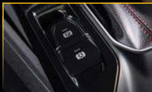
PHANH TAY ĐIỆN TỬ (E-PKB) & GIỮ PHANH TỰ ĐỘNG (AVH)