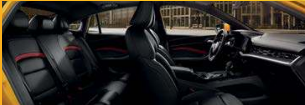
KHOANG NỘI THẤT RỘNG RÃI VỚI GHẾ LÁI THỂ THAO CHỈNH ĐIỆN 6 HƯỚNG *