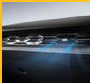
ĐIỀU HÒA KHÔNG KHÍ VỚI HỆ THỐNG LỌC BỤI MỊN PM2.5