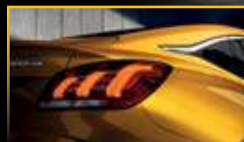
ĐÈN HẬU LED BẮT MẮT