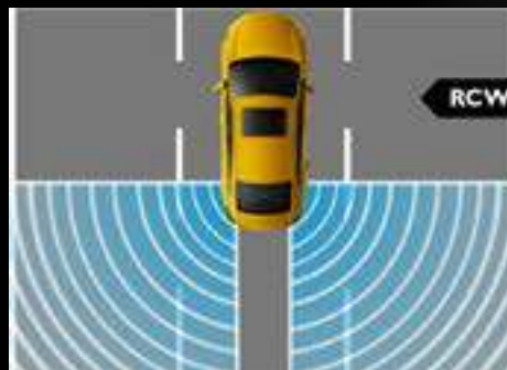
HỆ THỐNG CẢNH BÁO PHƯƠNG TIỆN VA CHẠM TỪ PHÍA SAU (RCW) *