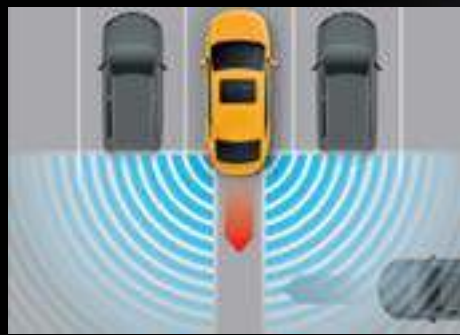
HỆ THỐNG CẢNH BÁO PHƯƠNG TIỆN CẮT NGANG PHÍA SAU (RCTA) *