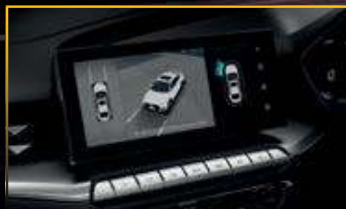
CAMERA 360° HIỂN THỊ 3D *