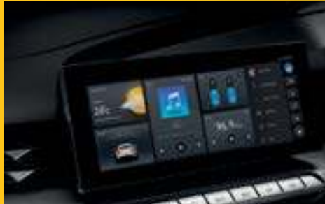
MÀN HÌNH CẢM ỨNG 10" KẾT NỐI APPLE CARPLAY VÀ ANDROID AUTO