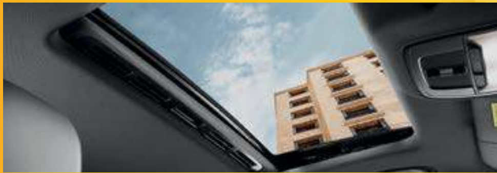
CỬA SỔ TRỜI VỚI 4 CHẾ ĐỘ ĐIỀU CHỈNH *